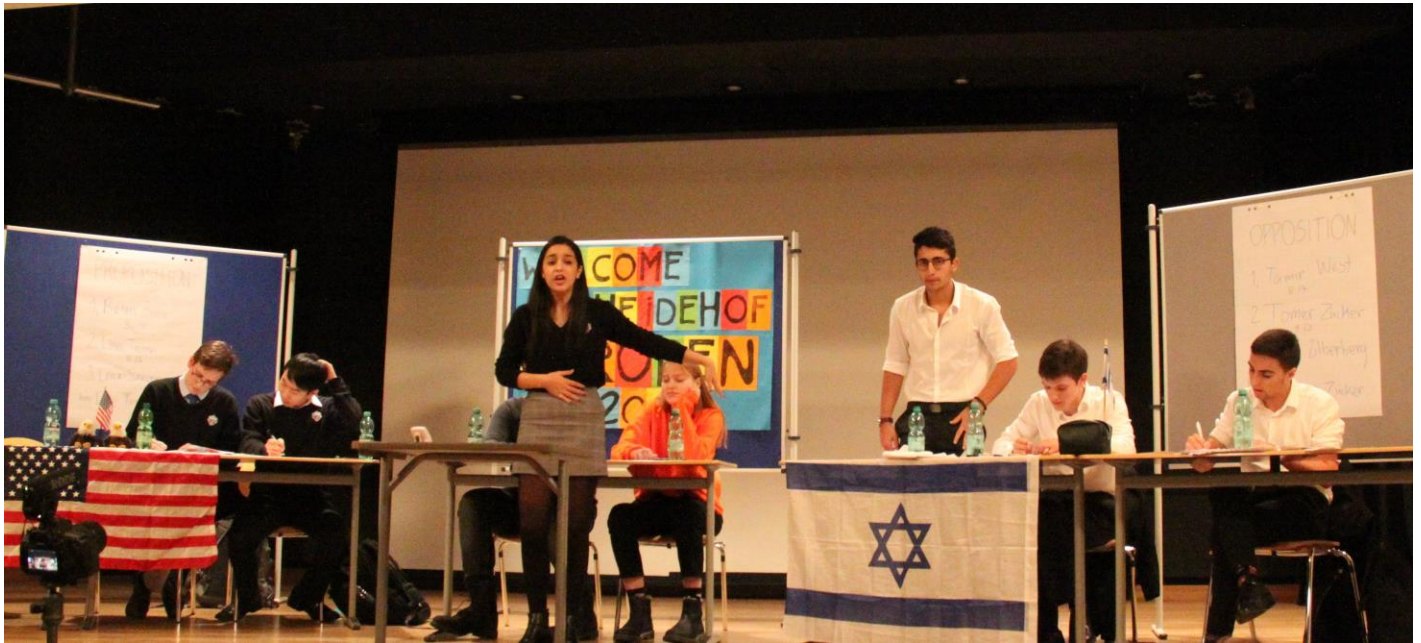
Hier: Semifinals der EurOpen 2018, USA Black gegen Israel – auf der EHG Aula-Bühne