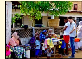
Straßenverkauf vor der Schule

Die Ernährungsgewohnheiten und -bedingungen in den togoischen Familien werden erhoben. Bei Markt- und Plantagenbesuchen sollen lokale Produktions- und Marktbedingungen untersucht werden. Die Auswirkungen des globalisierten Marktes auf die Lebensmittelproduktion in Togo werden erforscht und diskutiert.