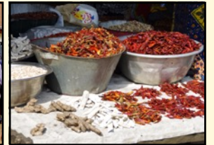
Auf dem Markt in Agoè-Zongo