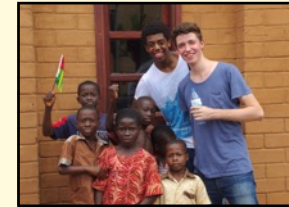
Begegnung am Tag der offenen Tür 2014

Gegenseitiges Kennenlernen und ein Vergleich der Schülererfahrungen bilden den Auftakt. Der Austausch über die unterschiedlichen Kulturen mit je anderen Lebensmitteln, Gerichten, Klimabedingungen und Anbaumethoden bildet den Einstieg in das Projektthema. Gemeinsame Exkursionen zu Märkten und Plantagen vertiefen das Thema.