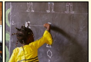
Analoge Sicherung von Arbeitsergebnissen