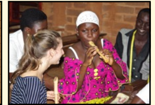
Begegnung beim Musizieren 2015